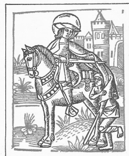
S. MARTINUS EP.