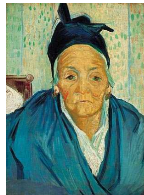
Sv. František Saleský (1567 - 1622)