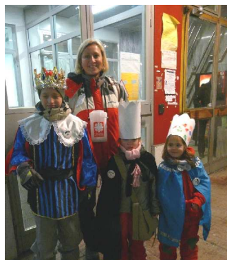
martinoviny - únor 2010