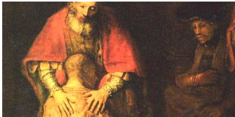
Foto: Rembrandt Harmenszoon van Rijn, Návrat ztraceného (marnotratného) syna, výřez

Co je náplní a účelem postní doby? Co a proč v postní době dělat?! Samotný název tohoto čtyřicetidenního období není zcela jednoznačný. Půst jako takový totiž není jeho jedinou náplní.