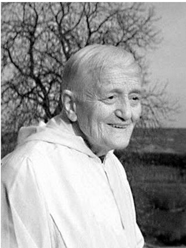
Zakladatel komunity Taizé Roger Schütz — Bratr Roger, *12.5.1915 †16.8.2005