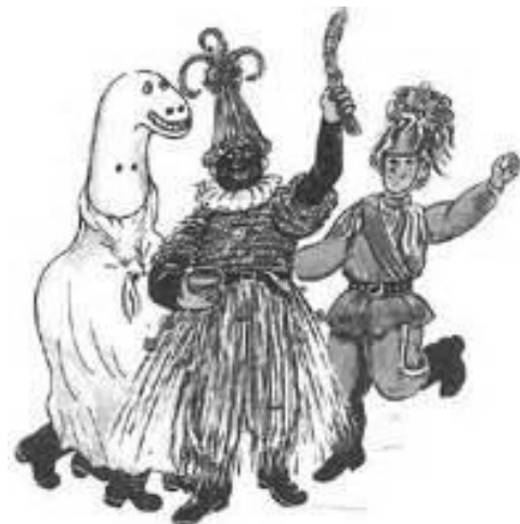
Masky slavného karnevalu z Benátek a proslulého masopustu na východní Moravě