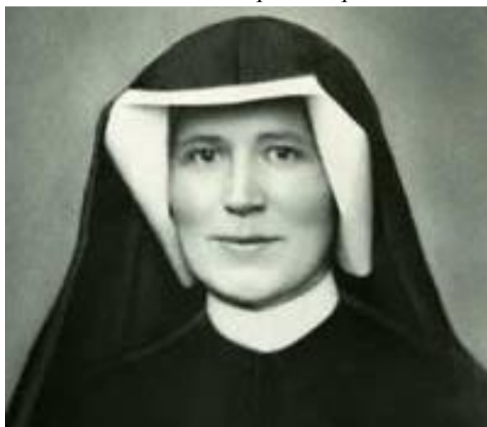
sestra Faustina Kowalská *1905 †1938