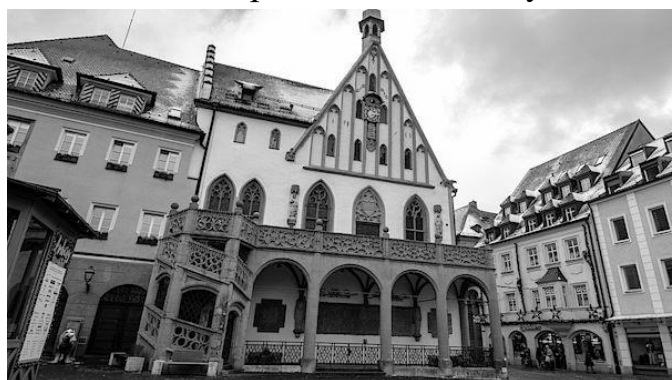
Amberg v Bavorsku.