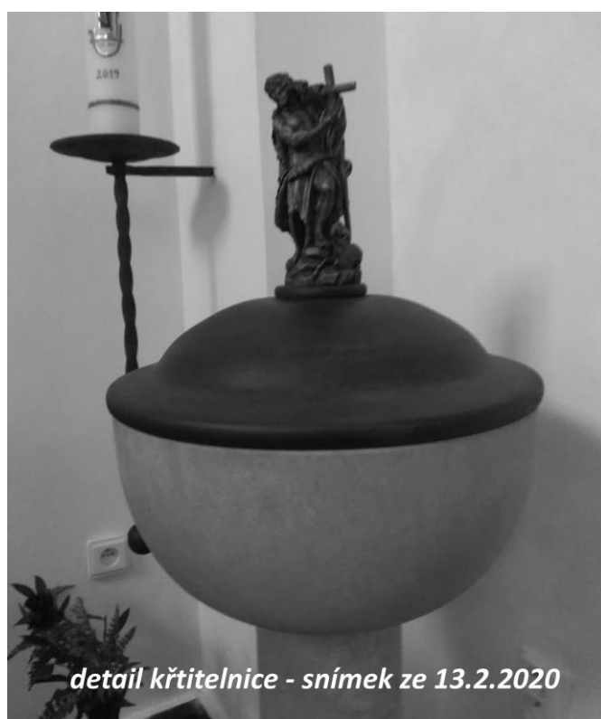
detail křtitelnice - snímek ze 13.2.2020