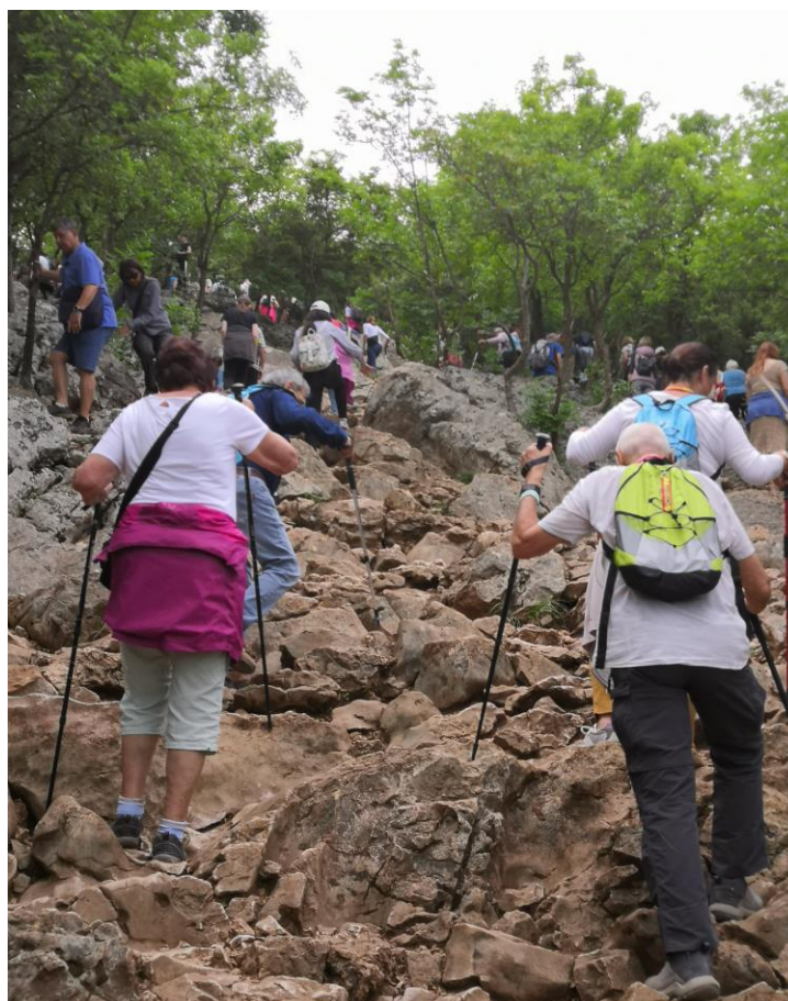
Cesty na poutní kopce

Podbrdo je místo prvního zjevení v roce 1981. Na cestě na Podbrdo jsou umístěny reliéfy 15 tajemství růžence. Procházejí tudy neustále skupiny modlících se poutníků. Nedaleko místa, odkud vychází cesta na Podbrdo, se nachází nádherná kaple Neposkvrněného srdce Panny Marie se zahradou a možností adorace.