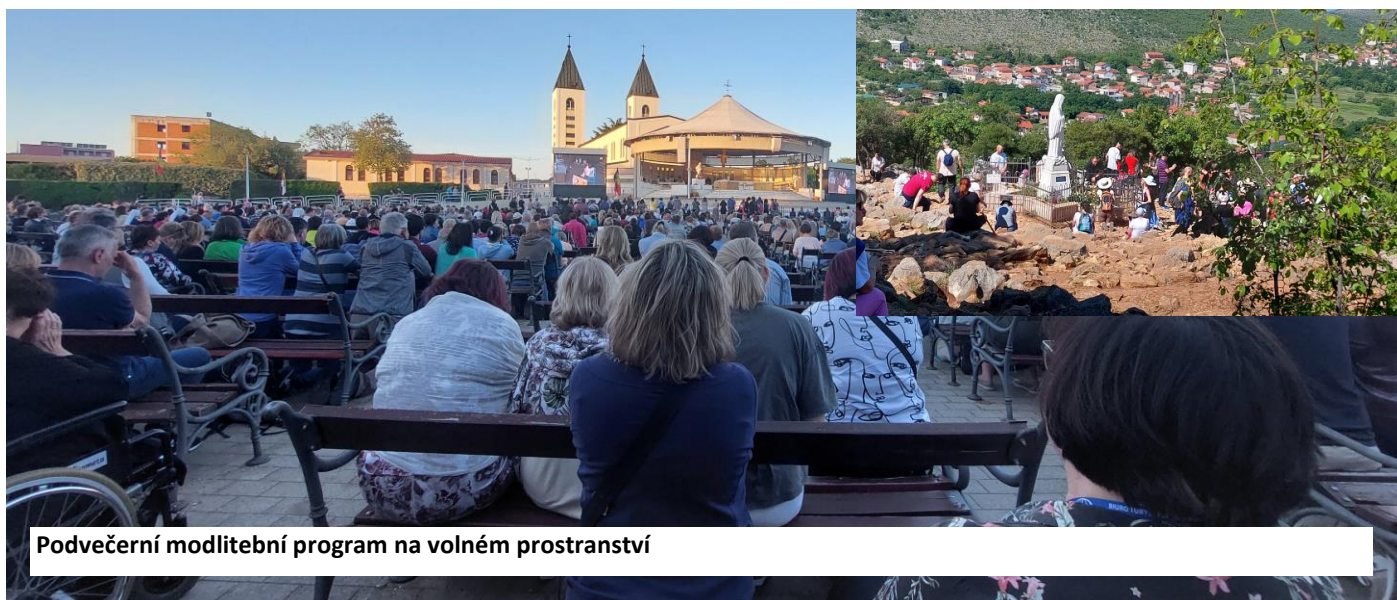
Podvečerní modlitební program na volném prostranství