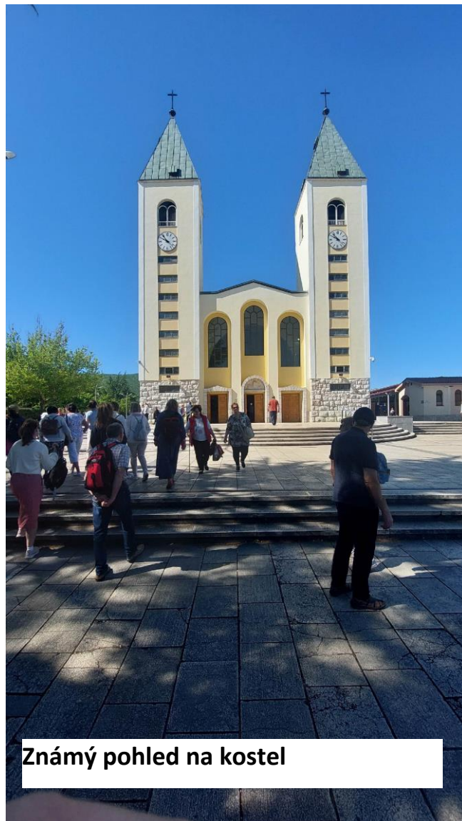
Známý pohled na kostel

každý den hlavní tříhodinový blok navečer mezi pátou a osmou hodinou. Skládá se z hodinové modlitby růžence, hodinové mše a pokračuje hodinou adorace nebo dalšího růžence.