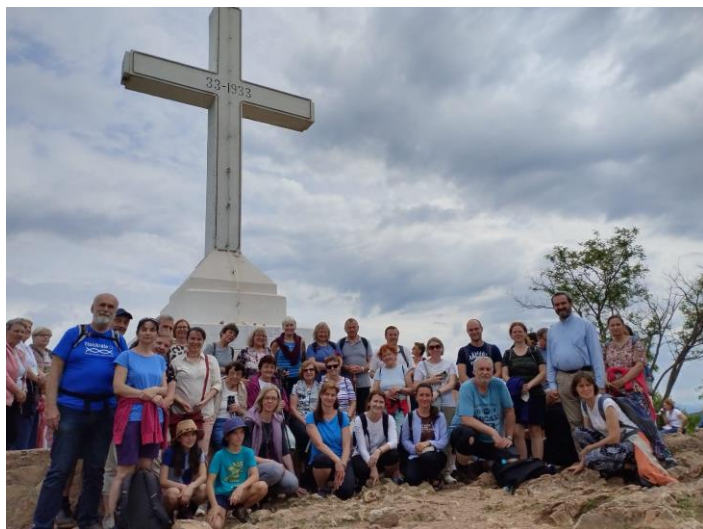
Naše výprava na Křiževaci

počet poutníků dosáhl dosavadního maxima kolem 20 tisíc. Ale v žádném případě to nepůsobí dojmem „přecpaného místa“.